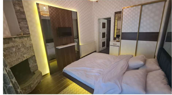
*Park Oda - Çiftlik