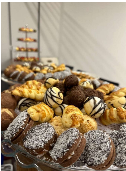
*Klasik Kahve Molası (Örnek)